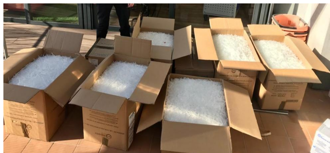
Recollida de caputxons de vacunes durant la pandèmia de la covid-19

Volem agrair molt sincerament la col·laboració de totes les entitats que fan possible el projecte d'Economia Circular per tal realitzar el servei Porta a porta: SENSE TRANSPORT NO HI HA ESPORT.